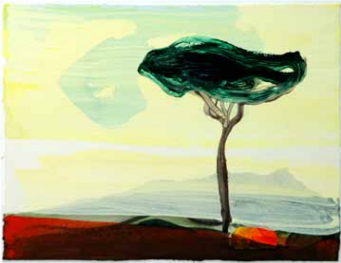
Peter van den Akker | 'Sotto il pino' | 2010 Gemengde techniek op papier/collage | 50 x 60 cm.