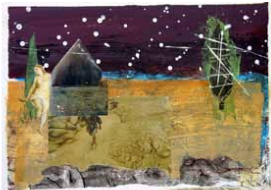
Renier Vaessen | 'Trees and signs of religion' | 2010 | Werk op papier | 32,5 x 50 cm.

Renier Vaessen kwam naar Montevettolini om te beginnen aan zijn boek 'Trees and Signs of Religion'. Het streven om zijn ideeën- en belevingswereld te implementeren in de Toscaanse omgeving resulteerde in de cyclus 'Cupressus sempervirens'. De kunstenaar adopteerde een cipres op de torro della murale waarop hij vanuit zijn werkruimte uitkeek. Hij maakte onder meer een tekening op ware grootte van de cipres die uitgroeit tot een metafoor voor het Toscane dat zich voor het geestes-oog van Renier Vaessen ontvouwt. In zijn werk versmelten architectuurelementen, mensbeelden, lichaamsfragmenten, voorwerpen (variërend van een theepot en huishoudtrapje tot vleeshaken, stukken bestrating en resten van een geruïneerde muur), beeldcitaten uit werk van illustere voorgangers en foto's uit oude archieven tot een nieuwe werkelijkheid die associatieve processen aanwakkert.