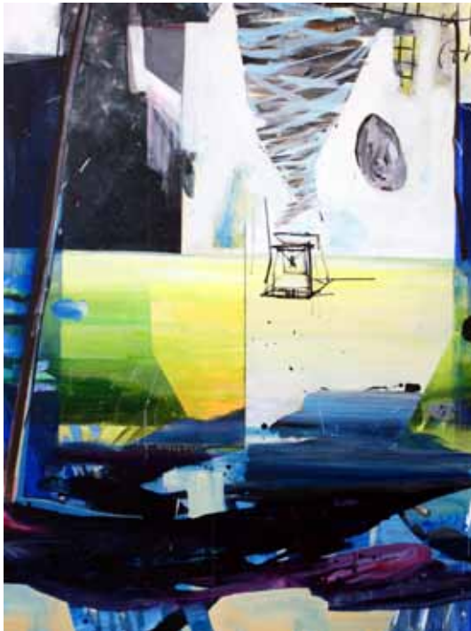
'Skies and Limits' | 2010 | Gemengde techniek op doek | 160 x 120 cm.

Naast het schilderen startte ik een schrijven, iets waarvoor ik de rust niet eerder vond. Het leegde mijn hoofd, vormde een schets vol kunst gerelateerde beschouwingen die uitgroeide tot een lijvig manuscript. De Frantoio vormde hiervoor op natuurlijke wijze de achtergrond.