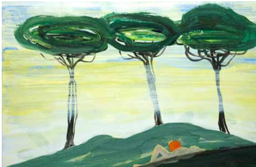
Peter van den Akker | 'Sotto di pini' | 2010 | Acryl en tempera op doek | 70 x 100 cm.

Haar visie werkte zij uit in de cyclus 'Incanto' waarin de betovering van het landschap een metafoor wordt voor de verwondering over een nieuwe actualiteit waarin schilderen en leven naadloos in elkaar schuiven en elkaar vervolmaken en waarin de kracht van de eenling zegeviert.