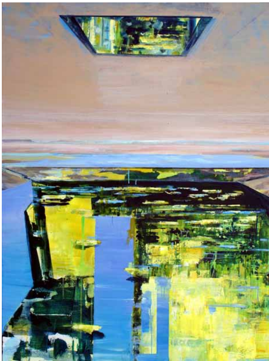
Yvonne Schroeten 'Geheel de hemel weerspiegeld' | 2011 Acryl op doek | 160 x 120 cm.