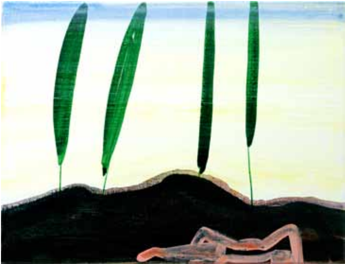
Peter van den Akker | 'Lonely land/la colina di Vinci' | 2010 Acryl/tempera op doek | 45 x 60 cm.