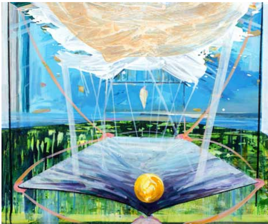
Yvonne Schroeten 'Geheel de hemel weerspiegeld' | 2011 Acryl op doek | 100 x 120 cm.