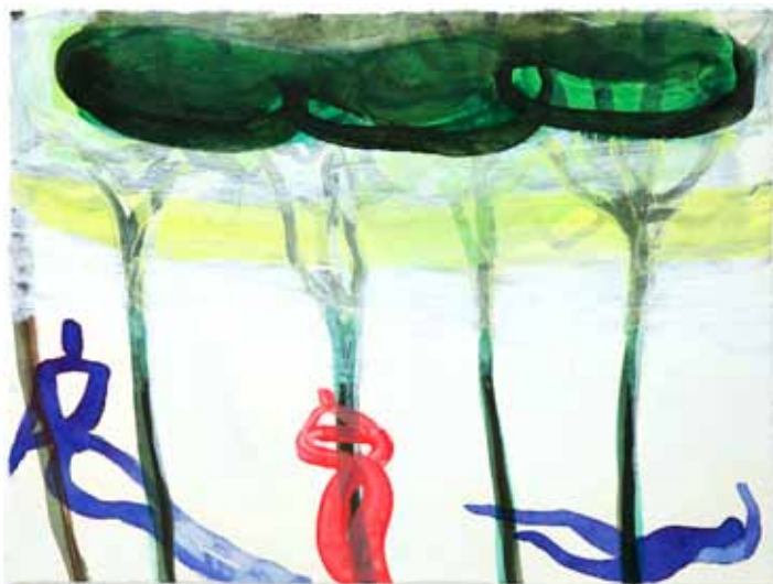
Peter van den Akker | 'Villa Ambra' | 2010 Gemengde techniek op papier/collage | 50 x 60 cm.