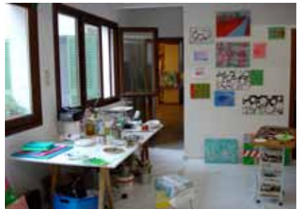
Voor de grote restauratie.