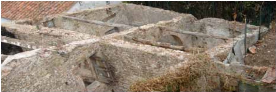
Frantoio, een oude olijmolen, in 2005 nog een ruïne uit de 14e eeuw.