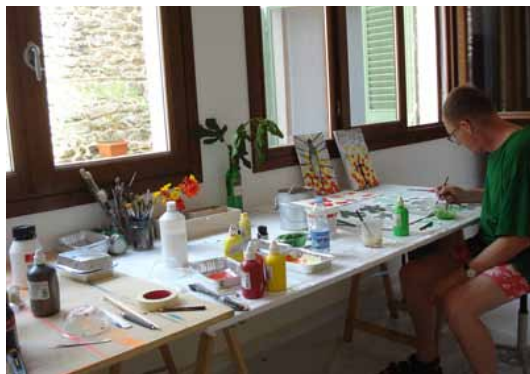
Aan het werk in het atelier in Montevettolini

F.C. Universiteit Twente | Saxion Hogescholen | SBK Middelburg | SBK Amstelveen | Rabo Bank C.B.K. De Krabbedans, Eindhoven | Artotheek Zuid Oost, Amsterdam | Achmea | Museum Waterland C.B.K. Utrecht | SBK Amsterdam | OAB Pink Roccade | NBM-Amstelland, Delft | Aegon | Amro Bank