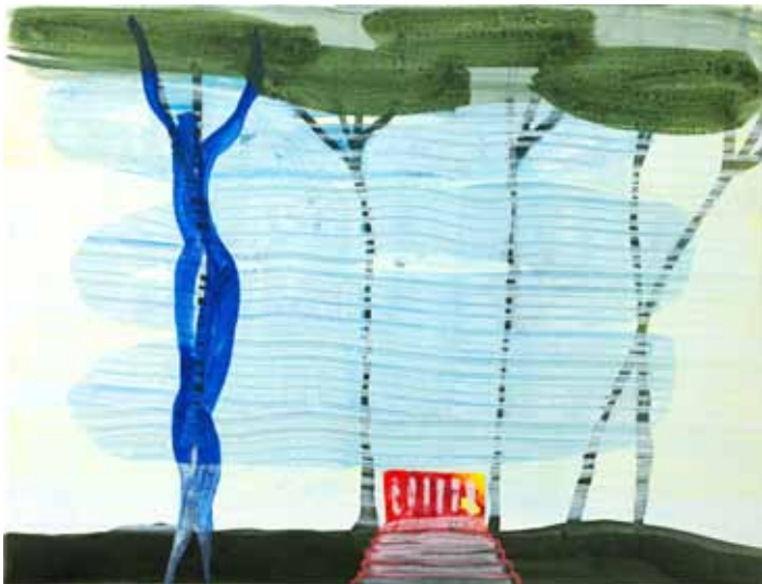
Peter van den Akker | 'Villa Ambra' | 2010 Acryl/tempera op doek | 45 x 60 cm.