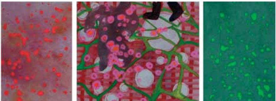
Uit de serie KANTIJ: 'Moeder Kind Netwerk' | 2009 / 2010 | Olie op doek | 24 x 18 - 30 - 18 cm.

Tot 2008 schilderde ik Harde Panorama's; stadsgezichten met bouwputten. Door mijn isolement kon ik deze niet meer schilderen. Amsterdam was te ver weg. Toen ben ik helemaal opnieuw begonnen. Eerst ben ik verdwaald in de doolhof van mijn eigen creativiteit. Maar dan kreeg ik oog voor het direct waarneembare en begon anders te schilderen. Geen bouwputten en lege straten meer, maar veel kleur, mensen en beweging. Sindsdien schilder ik mijn beleving over mijn omgeving: zo ontstaan de Zachte Panorama's uit de series INCANTO (betovering) en KANTIJ.