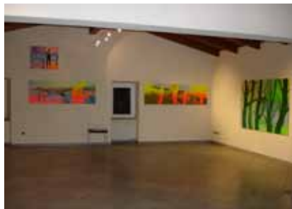
Projectruimte boven in de Frantoio