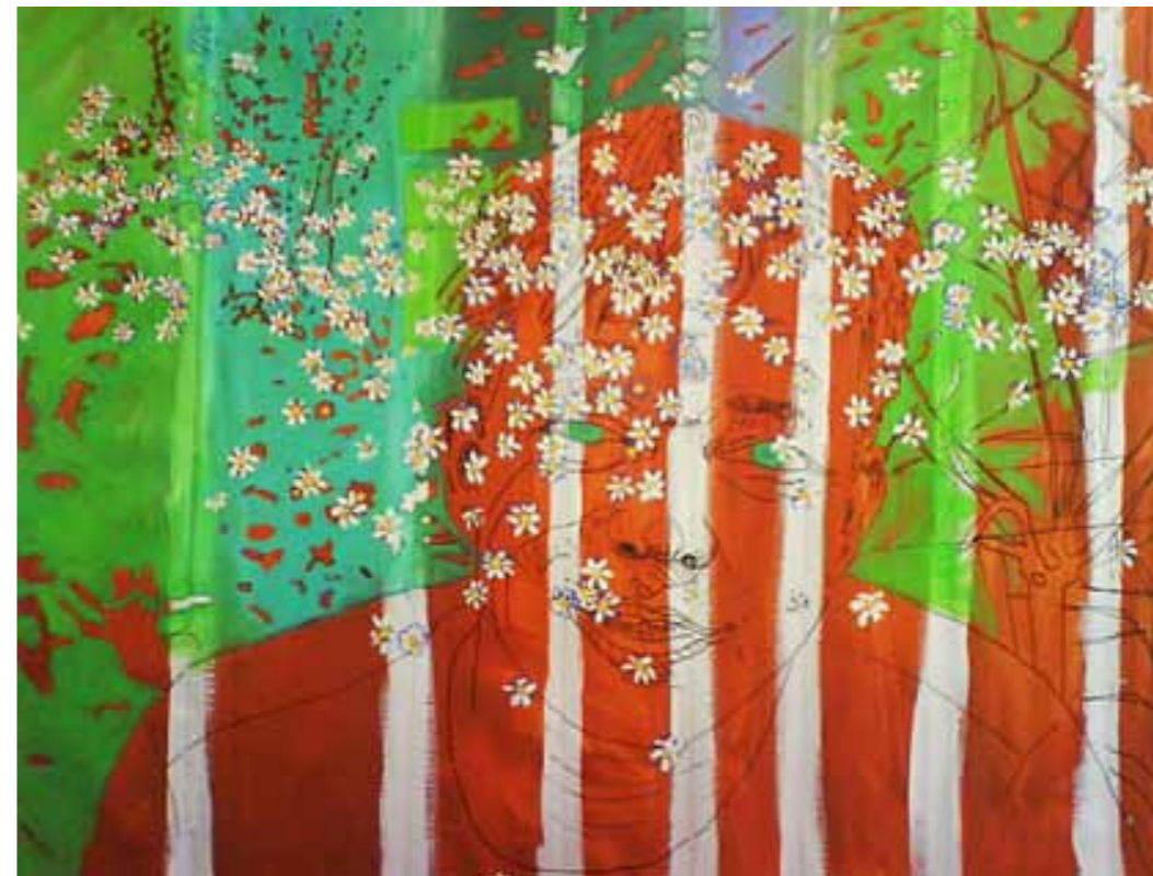
I'm SURE (I've seen it in your eyes)