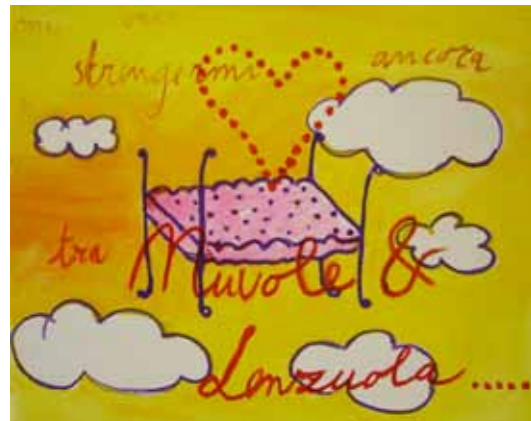
tra nuvole e lenzuola (between sheet sand clouds)