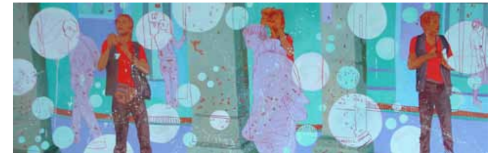
Ti ho visto in Borgo Stretto (I've seen you in B.S.)