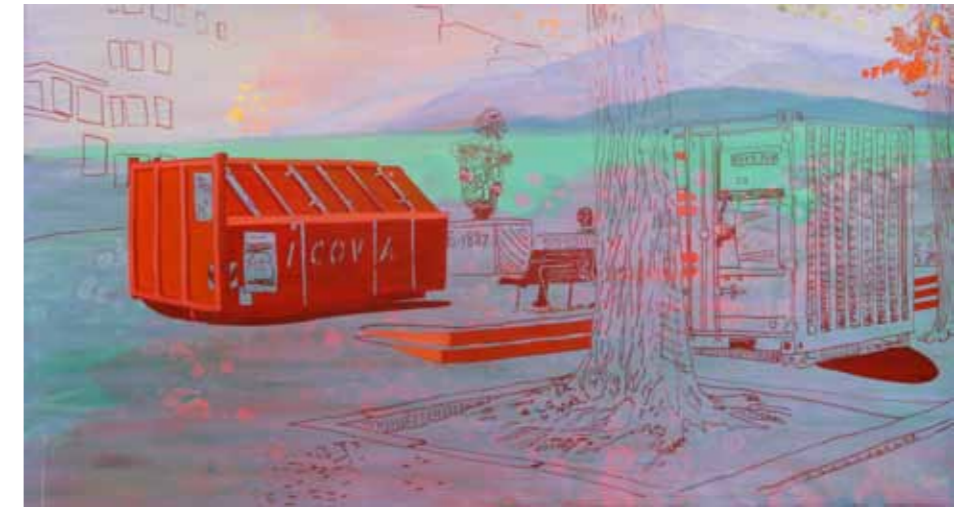
Multatuli in Vinci